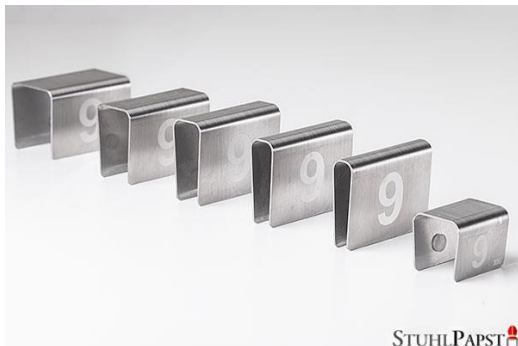
HAR.MONIE Nummerierung Klemme Klein